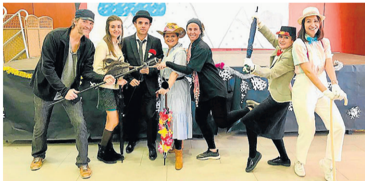
Maestros de Rosales del Canal, en la coreografía de Mary Poppins.

Junto al resto de sus compañeros, vivieron un momento muy especial esta semana cuando el